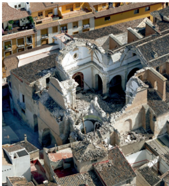
Lorca es una zona de riesgo sísmico, y por ello ha sufrido varios terremotos a lo largo de la historia.